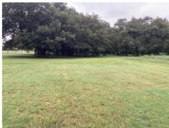
アグリフィールド内より①方面