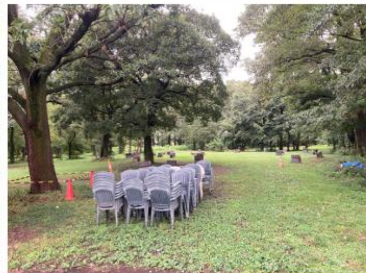
②よりデイキャンプエリア