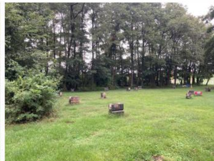
デイキャンプエリア内