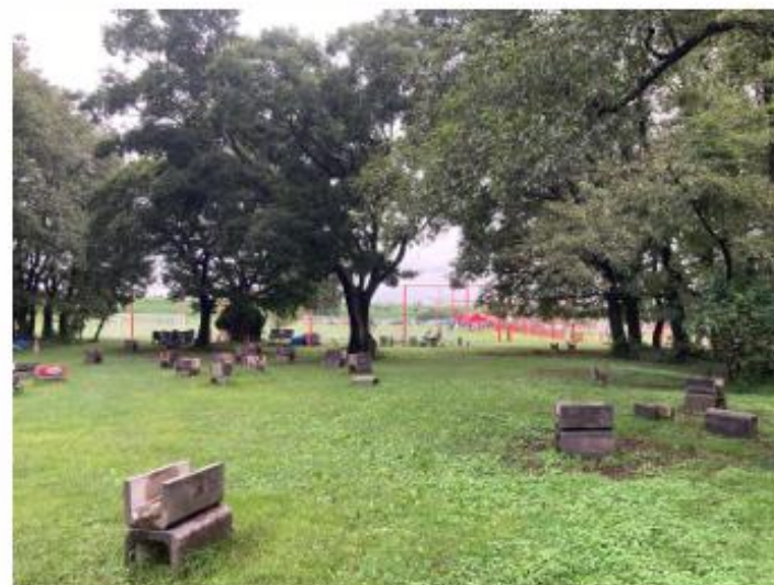
デイキャンプエリアから②方面