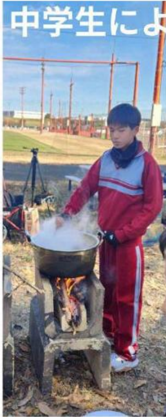
中学生による炊き出し訓練