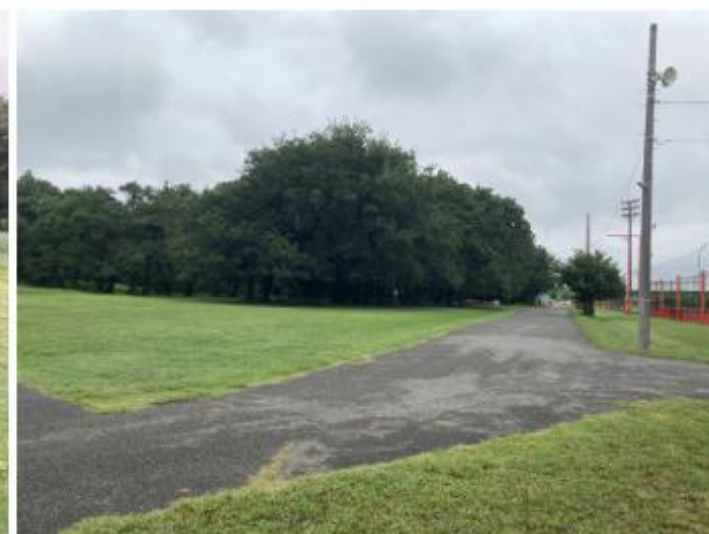
①よりデイキャンプエリア方面