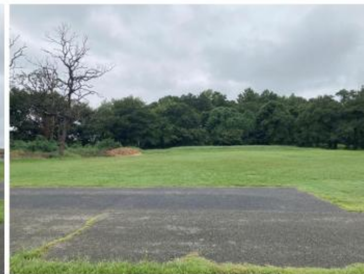
①よりアグリフィールド方面