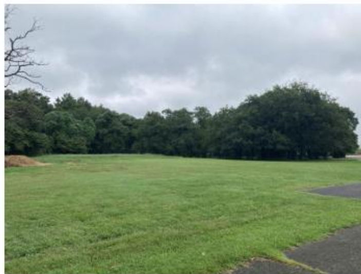
①よりアグリフィールド方面