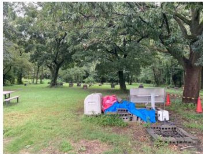
②よりデイキャンプエリア